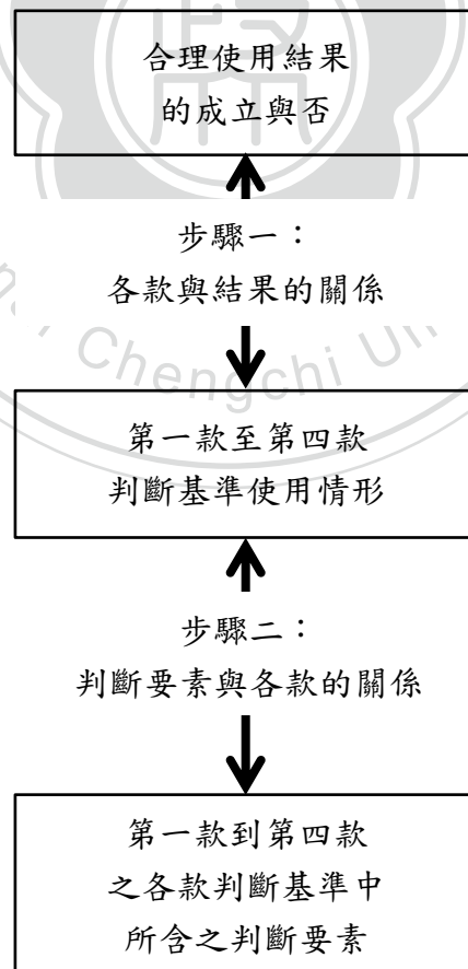
圖3 本文進行邏輯迴歸分析之邏輯架構圖

輯迴歸分析方法配合合理使用結果的兩種情形(成立合理使用與不成立合理使用)來分析變數被檢驗或通過,不過由於原始編碼情形分為三類,因此本文乃以下列表3之編碼調整的方式來進行二元的邏輯迴歸分析:在針對討論合理使用成立與否的情形下,成立合理使用(1)為依變數=1,不成立合理使用(2)為依變數=0;而自變數的表現有三類就使用兩個虛擬變數來量化並分成兩次為檢驗,一為對自變項的原始編碼是以對被告有利之(1)=1來討論,二則是為對自變數的原始編碼已對報告不利之(2)=1來編碼,其餘則以0為編碼以避開此變項之影響,也就是當合理使用(1)=1時,自變項對被告有利(1)=1,其餘為0,以及當合理使用(1)=1時,自變項對被告不利(1)=1,其餘為0來進行討論。即,在不成立合理使用(2)為依變數=0的情形下,也是分為自變項對被告有利(1)=1,其餘為0,以及當不成立合理使用(2)=0時,自變項對被告不利(1)=1,其餘為0來進行討論之情形同;而為合理使用各款判斷基準與其判斷要素間的邏輯迴歸時,也是以相同的方式分四次來檢驗,茲不贅述。下圖3為本文所欲進行之邏輯迴歸的邏輯架構圖: