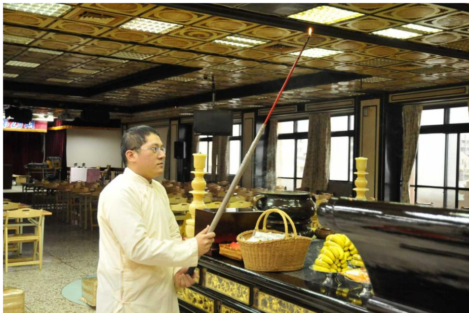
附圖 8.燒香（早、午、晚獻香禮）