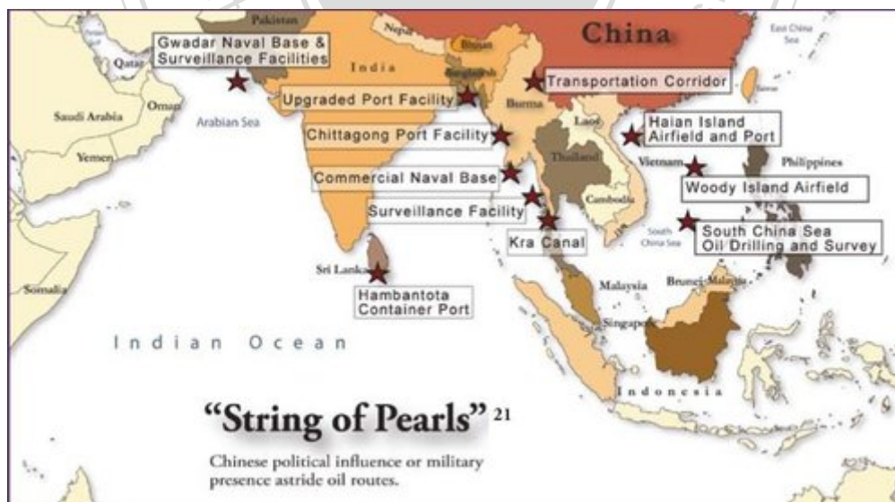
圖2 中共珍珠鏈戰略分布圖

根據王崑義：「珍珠鏈」戰略是在1994年初美國國防部的「亞洲的能源未來」報告中所指出，美國認為中國採取的這種「珍珠鏈」戰略，是企圖從中東到南中國海的海上航道沿線建立戰略關係，表明它保護中國能源利益，並同時為廣泛的安全目標，建構防禦與進攻態勢。珍珠鏈戰略中的六顆「珍珠」，包括巴基斯坦、孟加拉、緬甸、柬埔寨、南海、泰國等，中國透過各種合作關係加強港口、公路等建設，強化其軍事或經濟戰略作為。(如圖2)