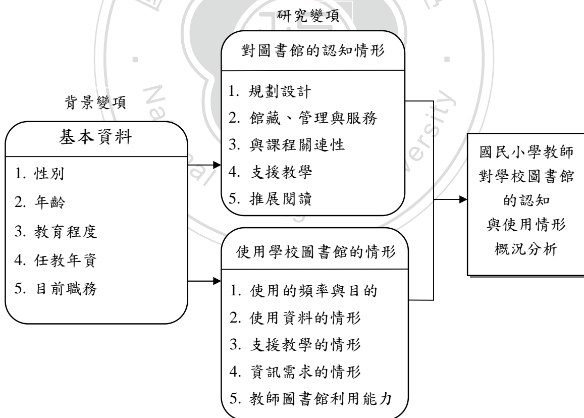
圖 3-1 研究架構圖

本研究之架構擬從「教師背景變項」探討「教師對圖書館的認知」與「教師使用圖書館的情形」，並透過問卷調查法蒐集客觀的具體資料，應用適當的統計方法加以分析處理，俾能發現與研究問題相關之事實。(參見圖 3-1)