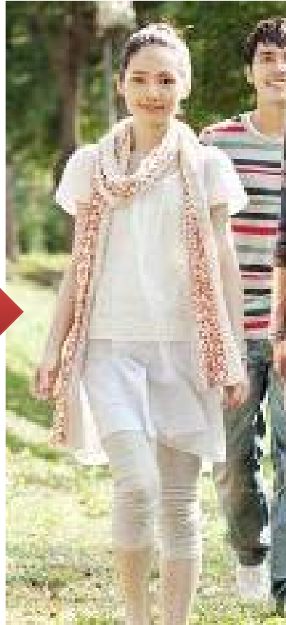
In Case of Love, 2009