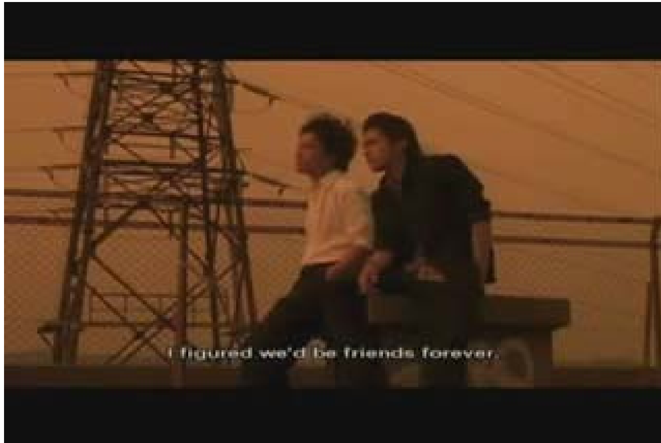
Crows Zero, 2007