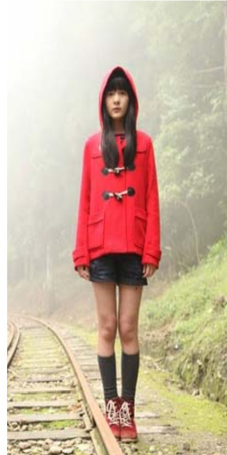
Starry, Starry Night, 2013