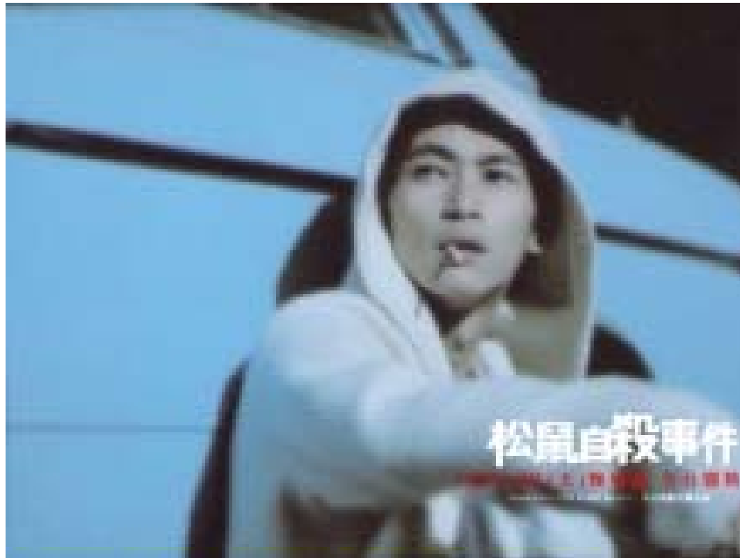
Yosuke Kubozuka in Amour-Legend , 2007 →Un-Japanese