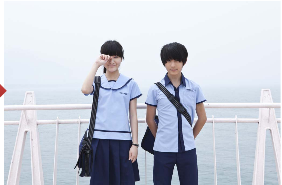
Starry, Starry Night, 2013