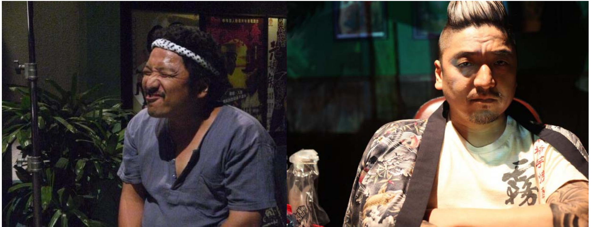
Forever Love, 2013