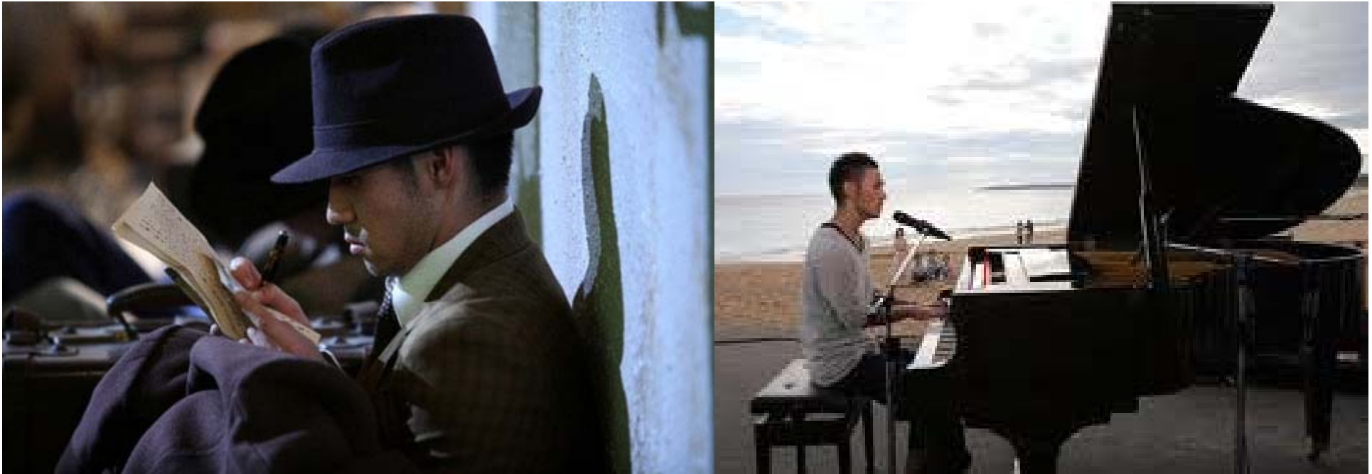
Atari Kousuke in Cape No. 7 , 2008 As both post/colonial memory and “cool” idol