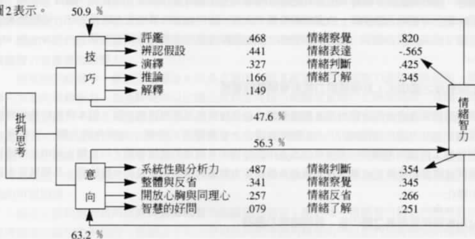
圖 2 批判思考與情緒智力間之預測關係圖

根據以上的結果，茲將批判思考與情緒智力間的區別準確率、重要影響因素與其標準化區別係數以圖 2 表示。