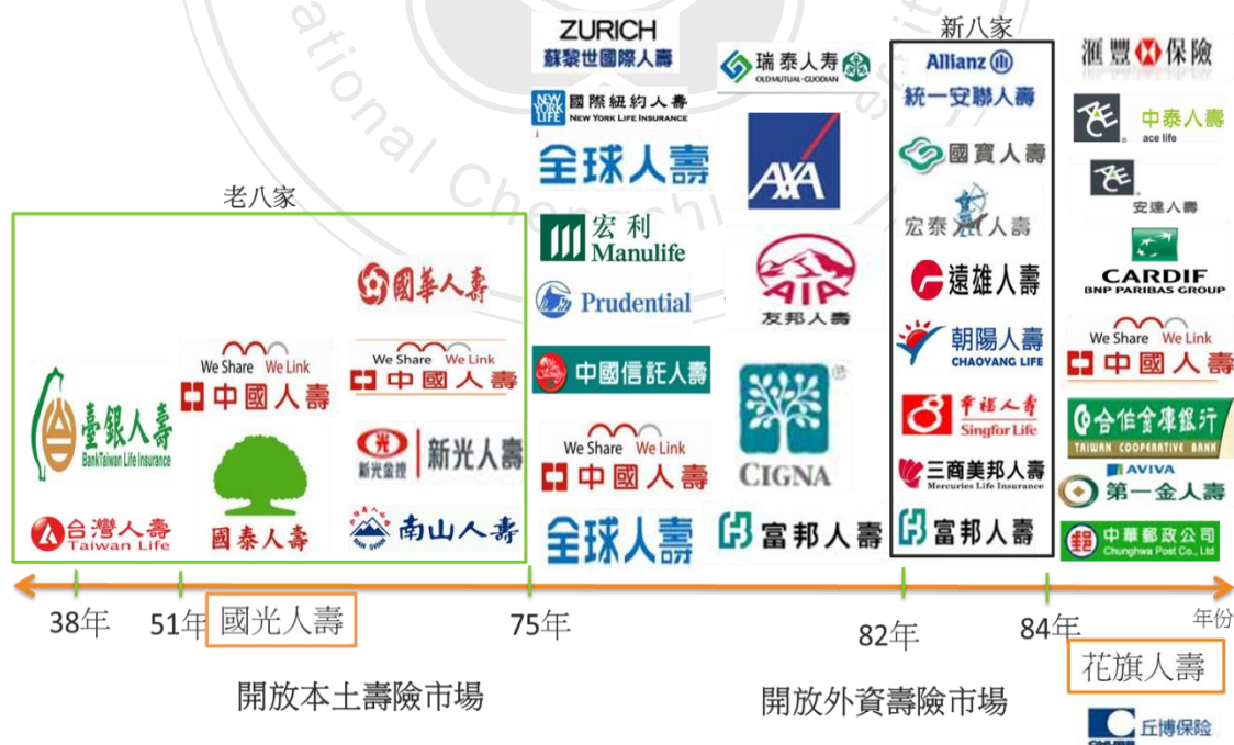
圖二：臺灣壽險市場歷史狀況