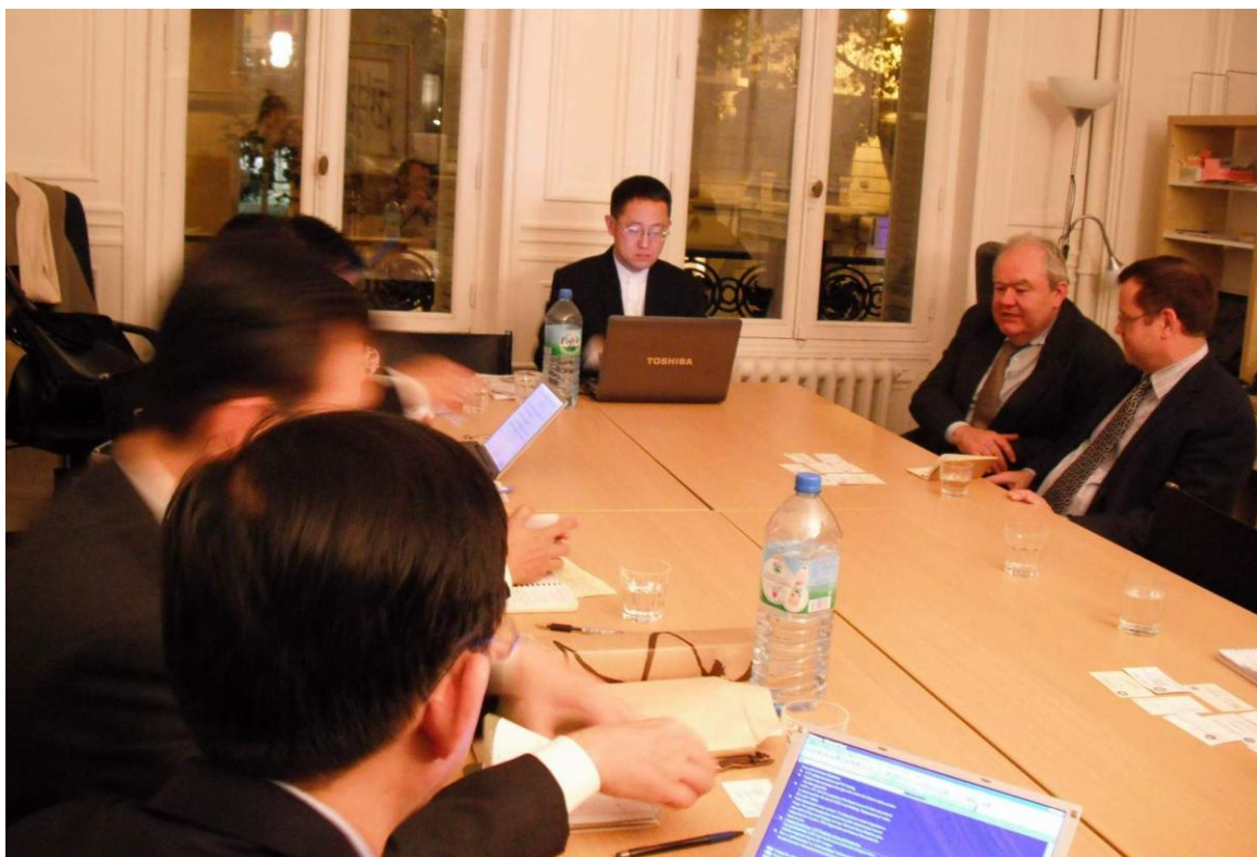
圖 2 訪問團成員與法國巴黎高等政治學院（ Sciences Po - Institut d'Études Politiques de Paris ）所屬亞洲中心(Asia Centre)會談情形。