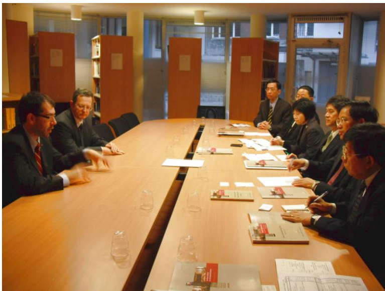
圖 2 會談情形。