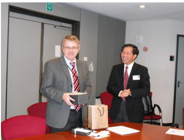
圖 3 訪問團林團長致贈紀念品。