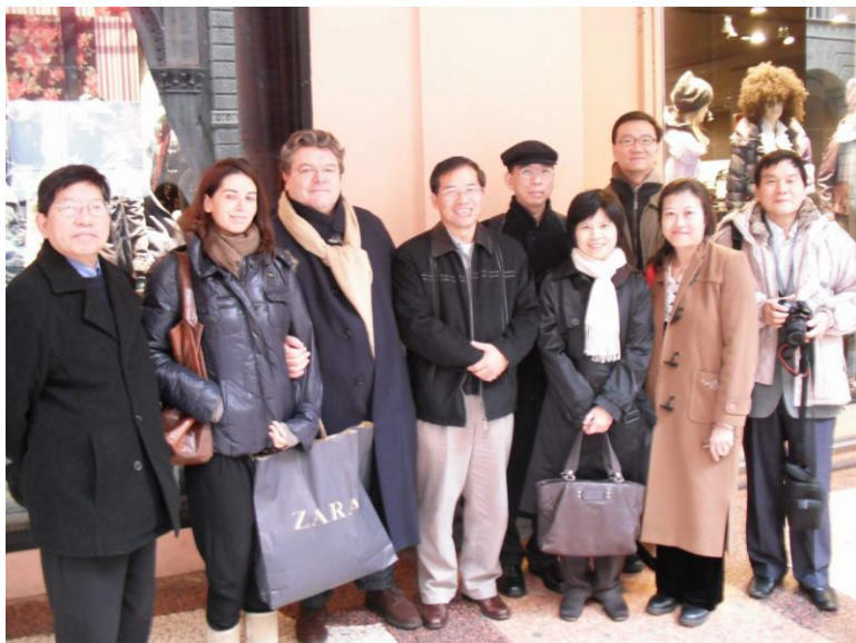
圖 1 訪問團成員由劉僑領鴻源(右 1)帶領參觀波隆納大學，巧遇 Emilia Romagna 州議會議長及(左 3)其女兒(左 2)。