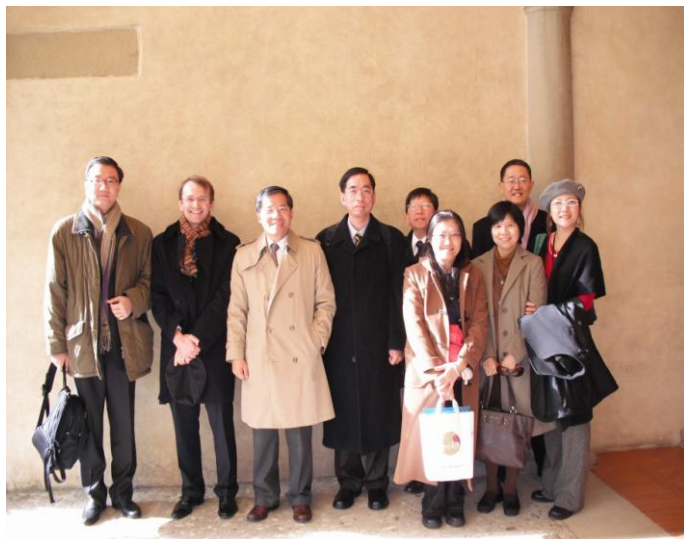
圖 4 訪問團成員會後與 European University Institute(EUI) 講座教授 Vennesson 合影留念。