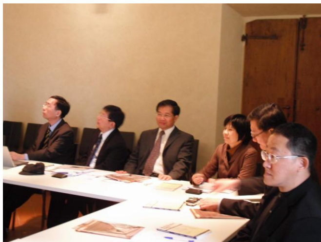
圖 2 訪問團成員。