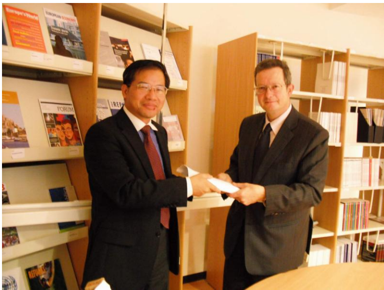
圖 3 訪問團林團長致贈紀念品。