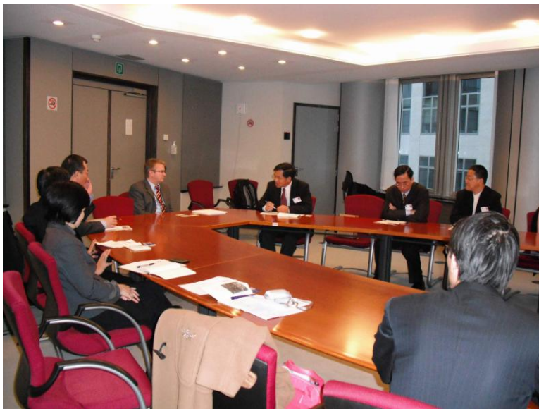
圖 2 會談情形。