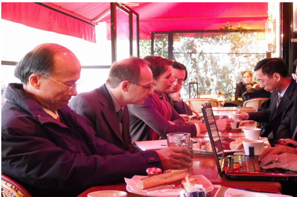
圖 2 呂大使(左 1)、訪問團成員、法國外交部展望司東亞主管 Mr. Arnaud d'Andurain (左 2)、及負責歐洲事務官員(左 3)會談情形。