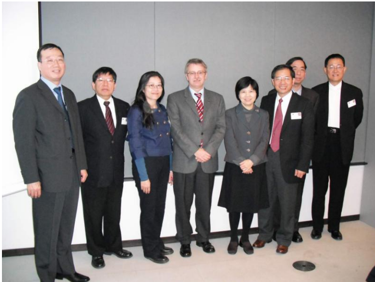
圖 1 訪問團成員會後與德國籍議員 Michael GAHLER(左 4)、駐歐盟兼駐比利時代表處議會組黃組長再求(左 1)等人合影留念。