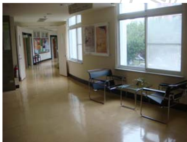
G 二、三樓走道布置休憩空間