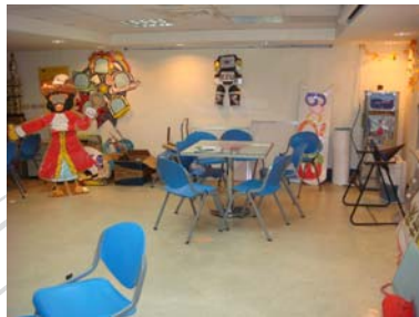
E 地下室社團活動空間