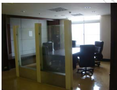
J 四樓走道師生討論桌