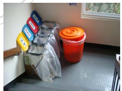
L 樓梯間資源回收中心