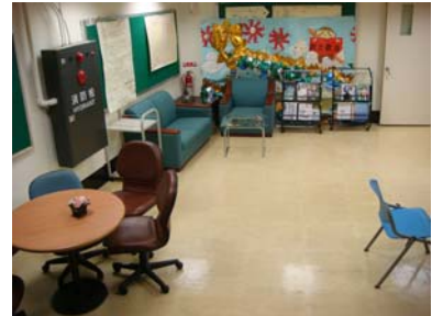
C 地下室走廊的交誼空間