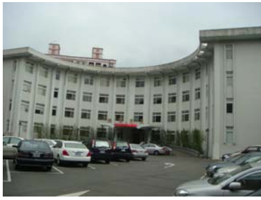
A 井塘樓整修後保留其純白 樣貌及圓弧造型