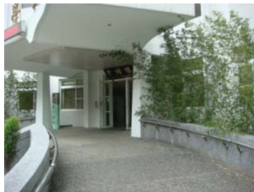
B 大門前寬敞的迎賓車道