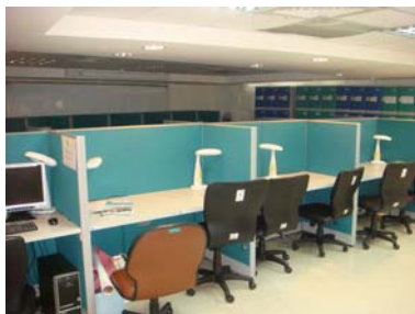
D 地下室研究生研究室