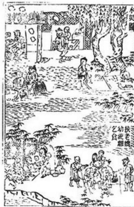
水災圖 扶老 幼食 乞食